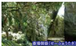
斎場御嶽(せーふあうたき)