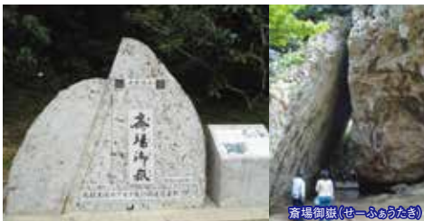
斎場御嶽(せーふあうたき)