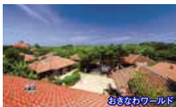
おきなわワールド