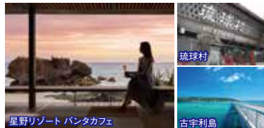
星野リゾート バンタカフェ

8:35集合 県庁前パレットくもじ(ニッポンレンタカー前) 9:05集合 おもろまちTギャラリア(洋服の青山側) 9:45集合 北谷(ちゃたん)アメリカンビレッジ 北谷観光情報センター前