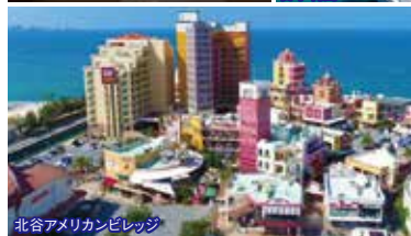
北谷アメリカンビレッジ

8:35集合 県庁前パレットくもじ(ニッポンレンタカー前) 9:05集合 おもろまちTギャラリア(洋服の青山側) 9:45集合 北谷(ちゃたん)アメリカンビレッジ 北谷観光情報センター前