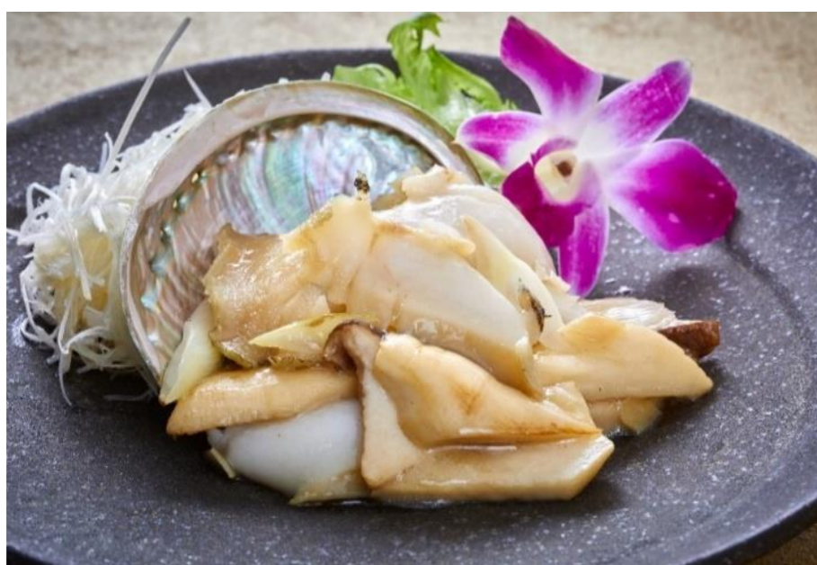
鮑とエリンギの塩炒め