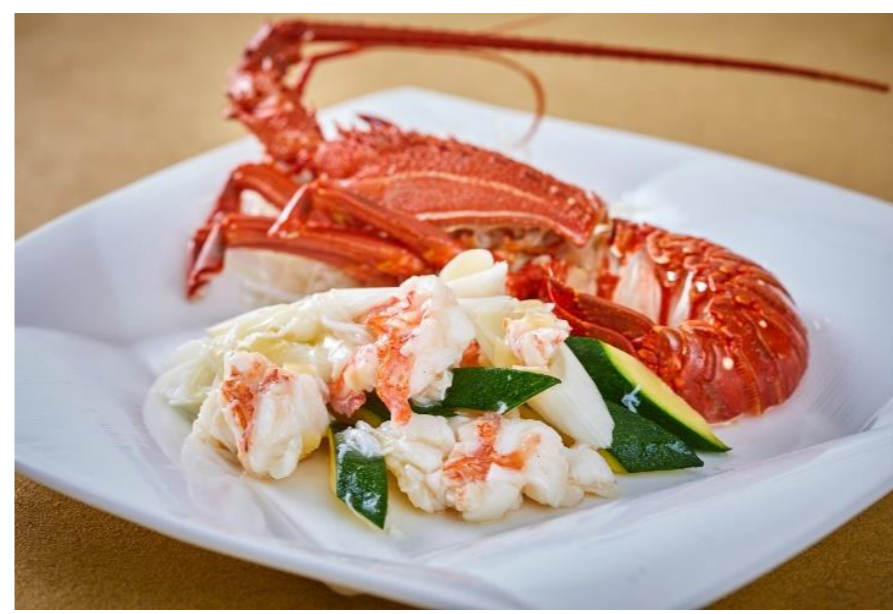
イセエビの塩炒め