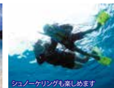
シュノーケリングも楽しめます