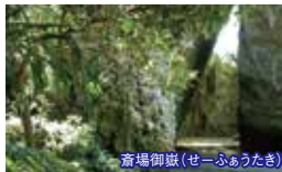
斎場御嶽(せーふあうたき)