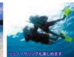
シュノーケリングも楽しめます