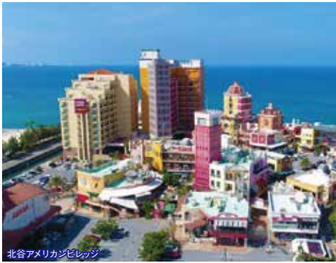
北谷アメリカンビレッジ