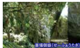
斎場御嶽(せーふうたき)