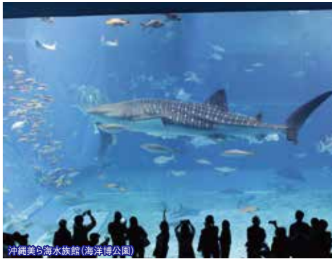
沖縄美ら海水族館(海洋博公園)